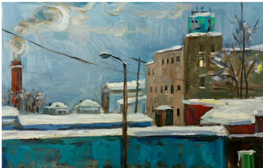
«На окраине города». Материалы: холст, масло