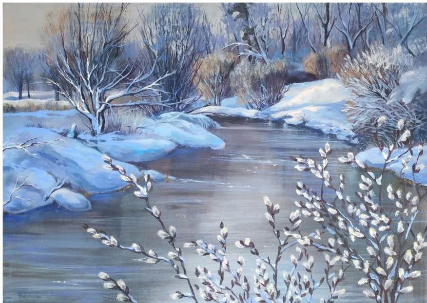
«Вербное воскресенье». Материалы: холст, масло