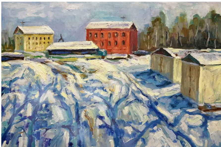
«Тени». Материалы: холст, масло