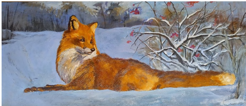
«Лисонька». Материалы: пенокартон, масло