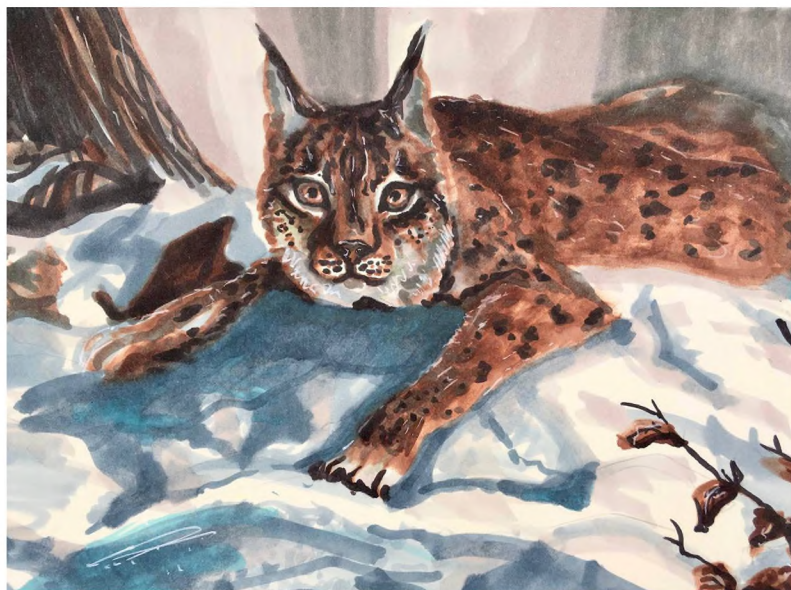
«Лесная королева». Материалы: маркеры, бумага

Художник: Екатерина Лобунько VK: @public216245301