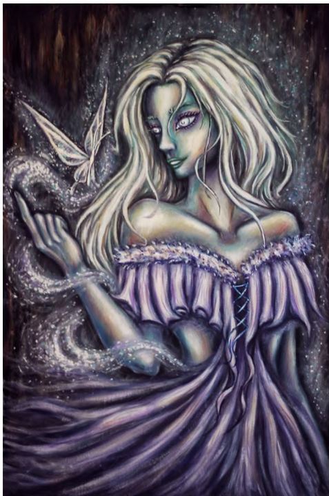
«Снежная нимфа». Материалы: гуашь, бумага

Художник: Лила Коновалова Telegram: lila_lira