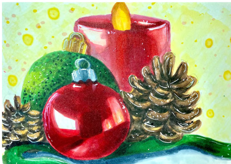
«Подготовка к празднику». Материалы: маркеры, бумага