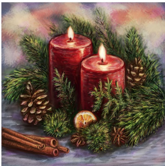
«Новогодние свечи». Материалы: фотешоп